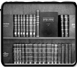
תורת מלך ערכים בתורת כ"ק אדמו"ר שליט"א