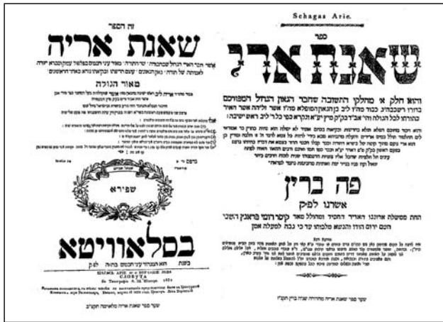
מהדורה שניה - שנת תקנ"ז שער הספר - שנת תקצ"ב

הט"ו), כי אם הטיל אדם ציצית נוספת על בגד שכבר מוטלת עליו ציצית, אם התכוון להוסיף הרי שתייהן פסולות. מקשה על-כך השאג"א: בסוגיית "זקן ממרא" למדנו כי ישנם כמה תנאים לחיובו של הזקן ממרא: מה שהוסיף על דברי תורה צריך להיות בדבר: שעיקרו מדברי תורה; פירושו מדברי סופרים; ויש בו להוסיף; ואם הוסיף גורע; והסקנו כי למעשה המצוה היחידה שיש בה תנאים אלו היא תפילין, ועיוין שם. והנה, לדעת הרמב"ם בהטיל ציצית נוספת שפוסל אף את הראשונות הרי לכאורה מקרה זה אף הוא עונה על הגדרות אלו: עיקרו מדברי תורה וכו', יש בו להוסיף, ואם הוסיף פוסל את הראשונות, שהרי קודם שהטיל את השניות היו הראשונות כשרות, וכעת בהטלת השניות הוא פוסל את הראשונות, והרי זה בבחינת "אם הוסיף גורע". ומדוע אם-כן אומרת הגמרא כי דבר זה יתכן אך-ורק בתפילין? (קושיה זו, בין שאר קושיותיו החזקות של השאג"א, מהווה כר נרחב בספרי האחרונים לענות בה ויתרוצים רבים נכתבו על-כך).