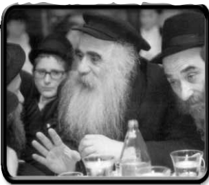
חסידים מספרים לקט סיפורי חסידים בנושאים שונים