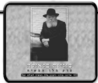
חדשות מעולם הישיבות