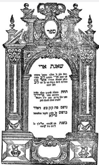
ספר שאגת ארי, ספרות הישיבה, בית המדרש, תל אביב