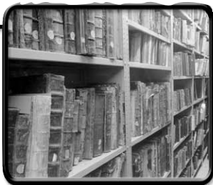
ממדף ספרי הישיבה