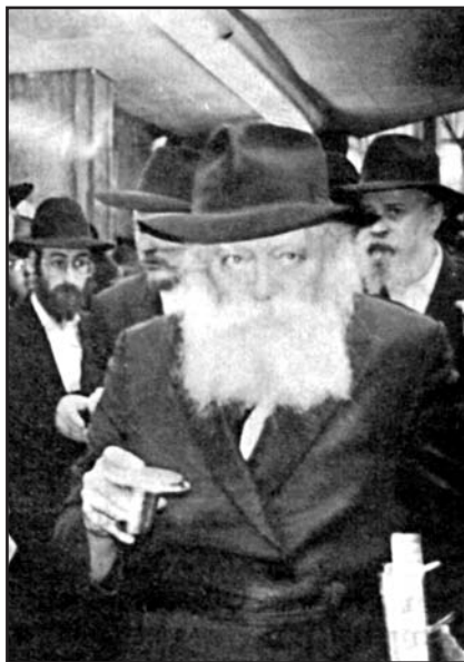
לאחר חלוקת "כוס של ברכה" במוצש"ק פ' נשא תנש"א

"כך תם יום ארוך מלא חוויות קדושות ומרוממות, ואין זה פלא שבו במקום נוצרו, ספונטנית, מעגלי ריקודים, והרבה מתאמצים לשמוע איש מפי חברו עוד 'ווארט', עוד ביטוי משיחות הקודש ועוד תיאור של אירועי ההתוועדות הפתאומית".